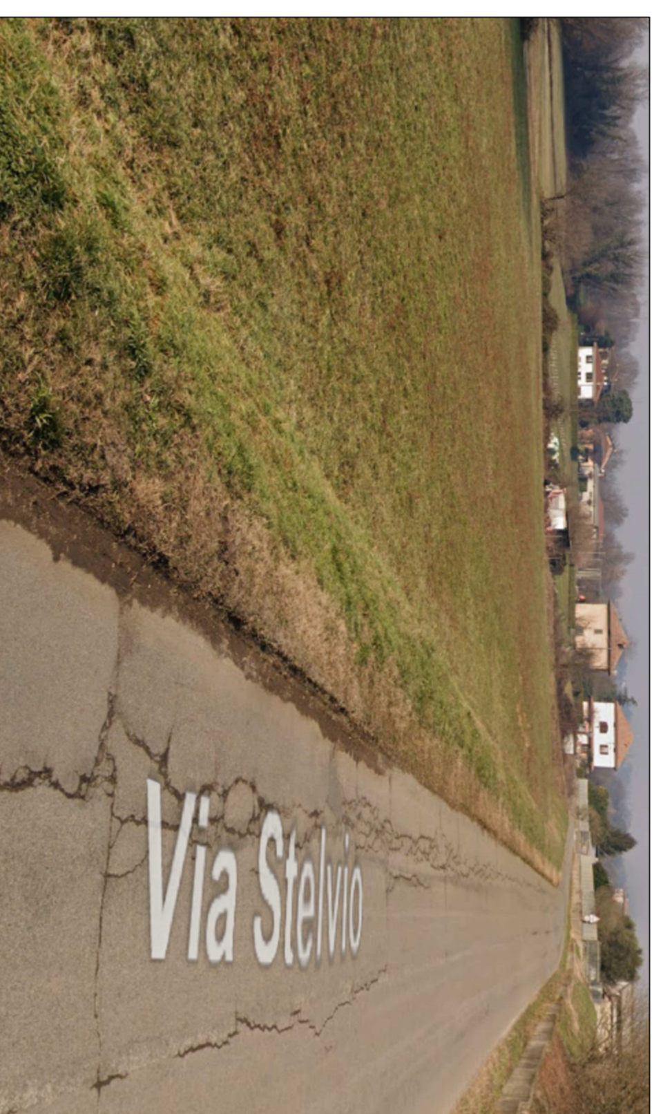
NODO 3 - STATO ATTUALE

COMUNE DI COREZZANA Provincia di Monza e Brianza