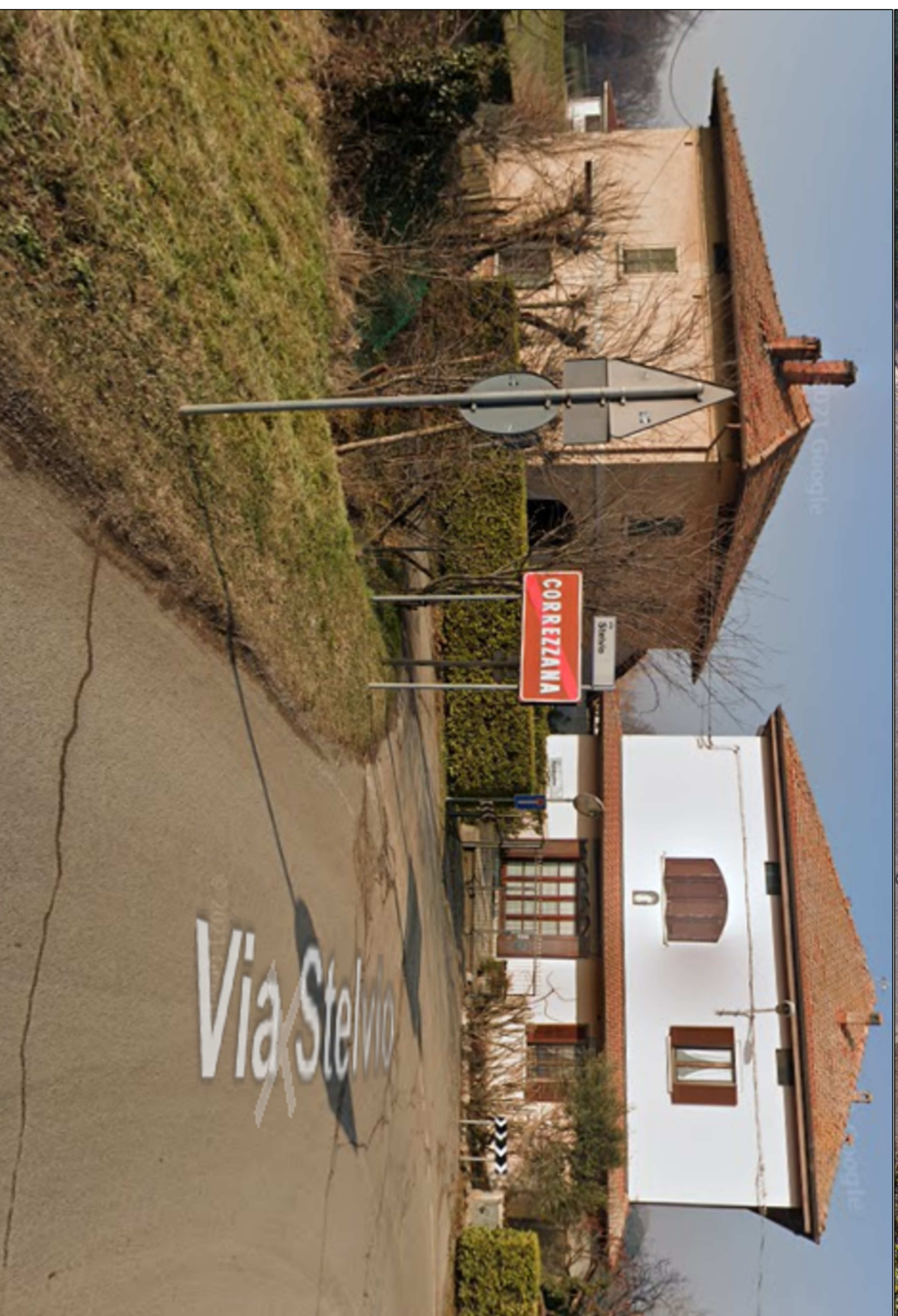
NODO 1 - STATO ATTUALE