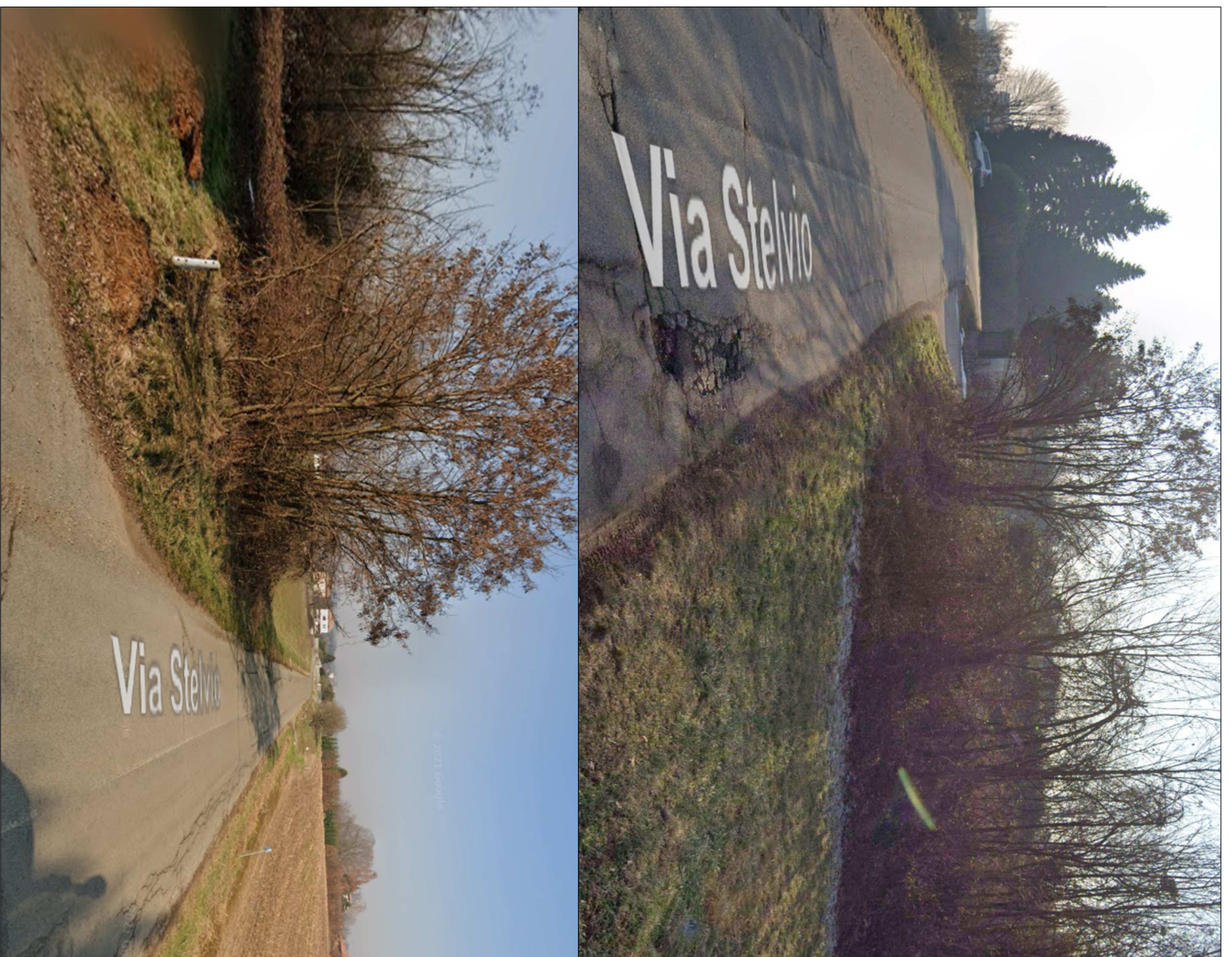
NODO 4 - STATO ATTUALE