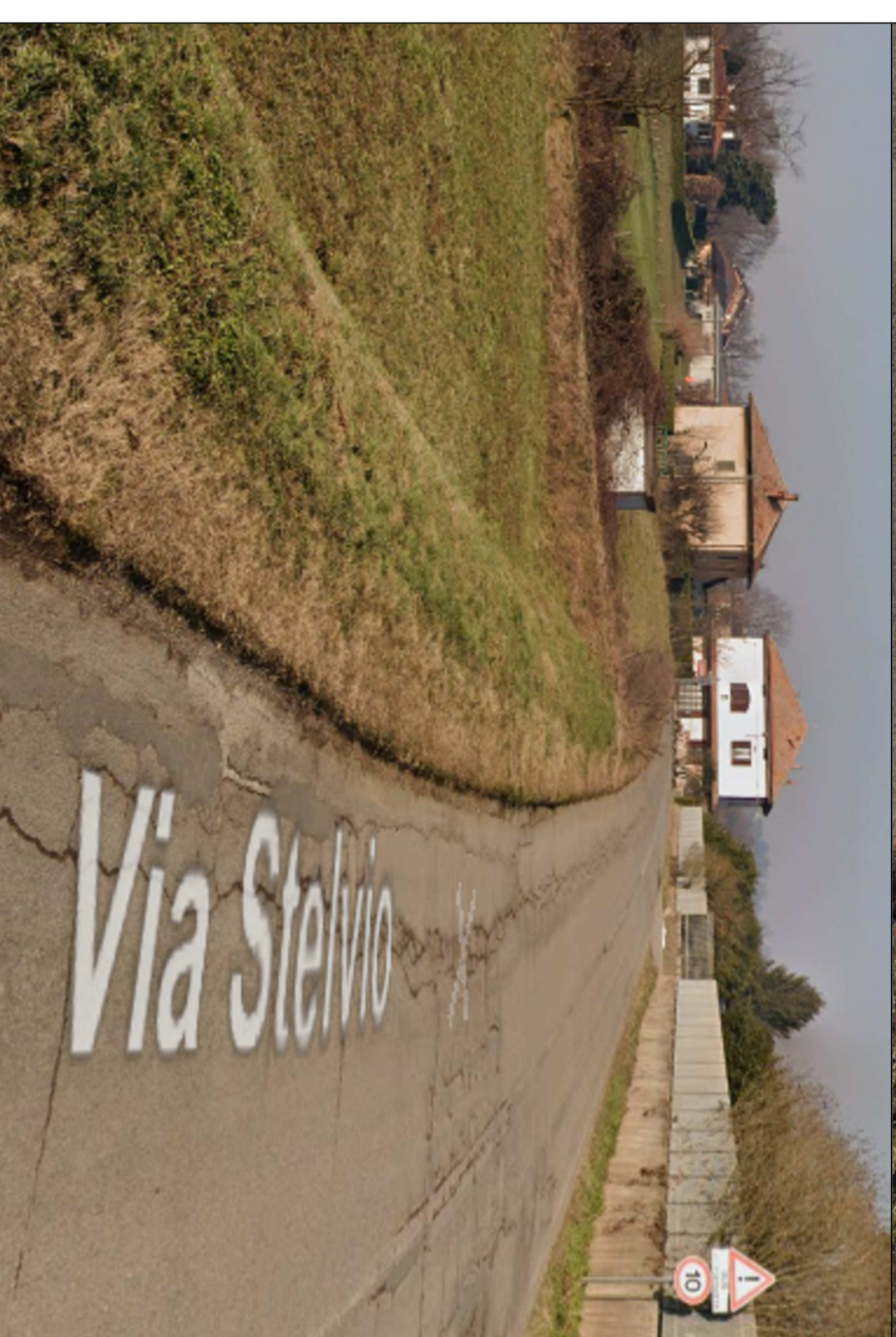
NODO 2 - STATO ATTUALE